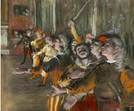
Les Choristes – Degas - 1877