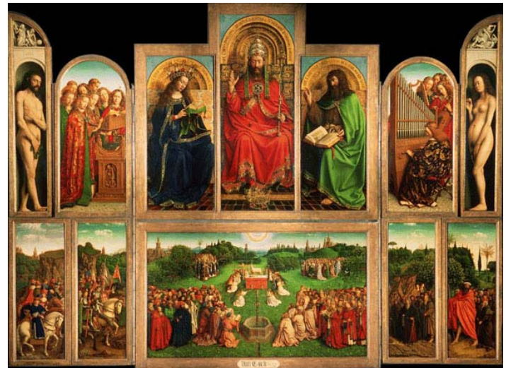
Les Juges justes – Van Eyck - 1432