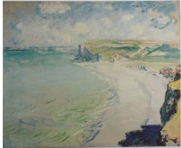
La plage de Pourville – Monet - 1882