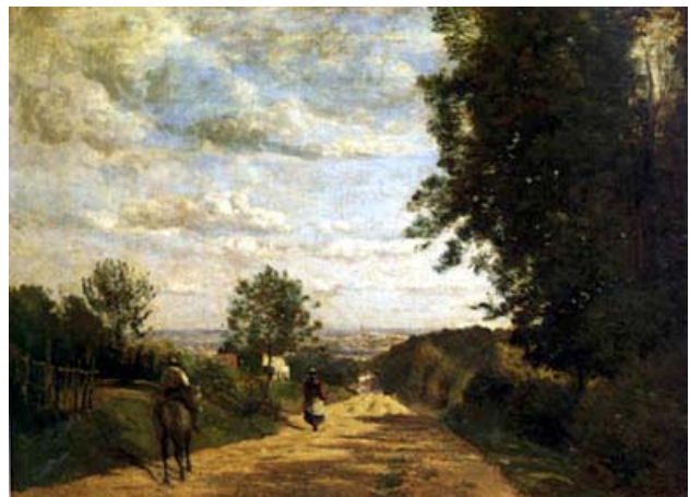
Le chemin de Sèvres – Corot - 1860

Quand et comment opèrent les malfaiteurs ? Certains préfèrent le calme de la nuit et ses possibilités d'infractions : fenêtre ouverte, silence, absence de surveillance. D'autres agissent en plein jour, sous le nez des gardiens, comme ce mystérieux inconnu qui déroba en plein Louvre bondé ' Le Chemin de Sèvres ' de Corot , sans découper la toile. Le 3 mai 1998, il emporte simplement le tableau, après avoir soulevé le verre de protection, en le dissimulant vraisemblablement sous un vêtement. Mais les choses ne se passent pas toujours aussi pacifiquement. En septembre 2009, par exemple, deux hommes font irruption , pistolet au poing, dans un musée de Bruxelles et forcent deux employés à se coucher au sol. Ils s'emparent ensuite de la toile de Magritte intitulée ' Olympia ' et prennent la fuite.