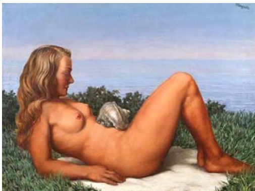
Olympia – Magritte -