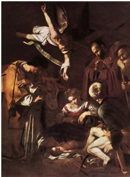
Nativité – Caravage – 1609 ...mangée par les cochons...