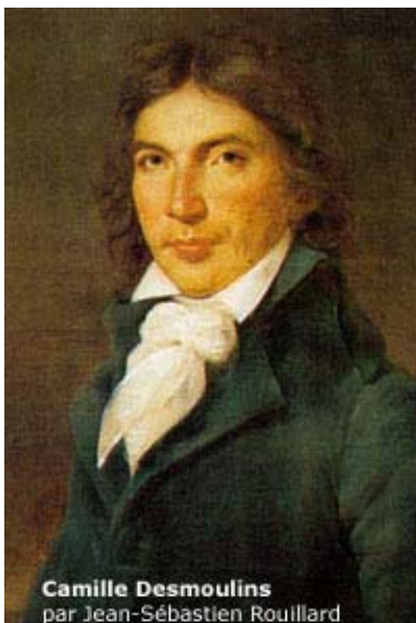
Camille Desmoulins par Jean-Sébastien Rouillard

Que faire ? S'emparer de la Bastille qui en contient une