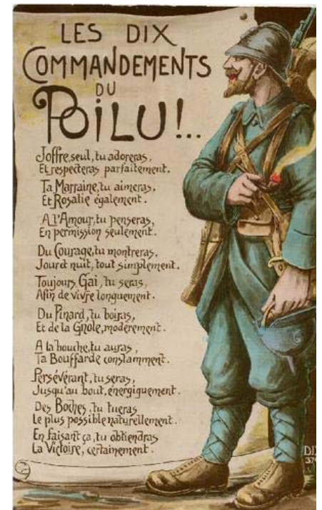
Le Maréchal Joffre commandait l'armée française pendant la guerre de 14-18.