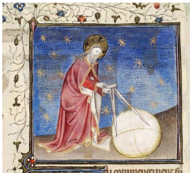
'Dieu écrit droit et nous lisons de travers'

Un de mes amis pense que même si c'est abominable de manger des fruits de mer (Lévitique 11:10), l'homosexualité est encore plus abominable. Je ne suis pas d'accord. Pouvez-vous régler notre différend ?