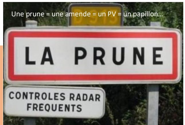
Une prune = une amende = un PV = un papillon...