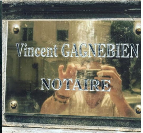
On le lui souhaite, mais pas sur le dos du client...