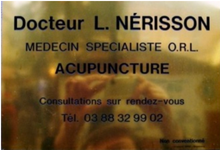
Un patronyme ne manquant pas de piquant !

(et si ne vous ne comprenez pas tout, voici un excellent sujet de conversation avec le premier Français que vous rencontrerez...)