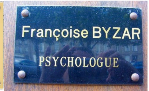
Clin d'œil à Louis Jovet, le Docteur Knock !