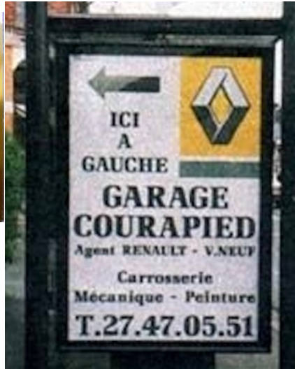
Spécialisé dans les pédibus...