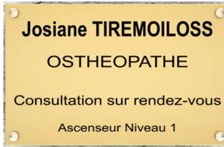
Faut pas pousser!