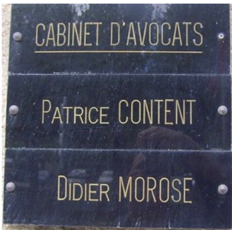
Ça fait un peu 'good cop – bad cop'!