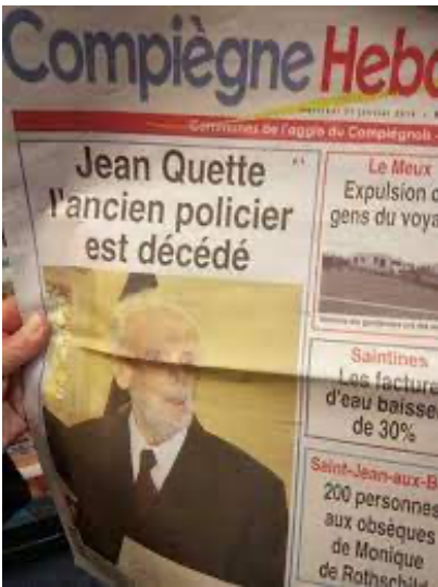
Il enquête maintenant dans l'au-delà...